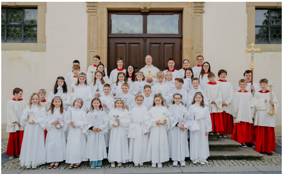
Erstkommunion 2026 St. Lambertus Mingolsheim