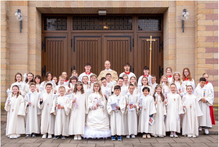
Erstkommunion 2026 St. Laurentius Kronau